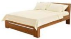
1. postel .....

skříň | koberec | postel | židle | křeslo | lampa | vana | stůl | lednička | sprcha | zrcadlo | kuchyňská linka | sporák a trouba myčka | obraz | pohovka/sedačka/gauč